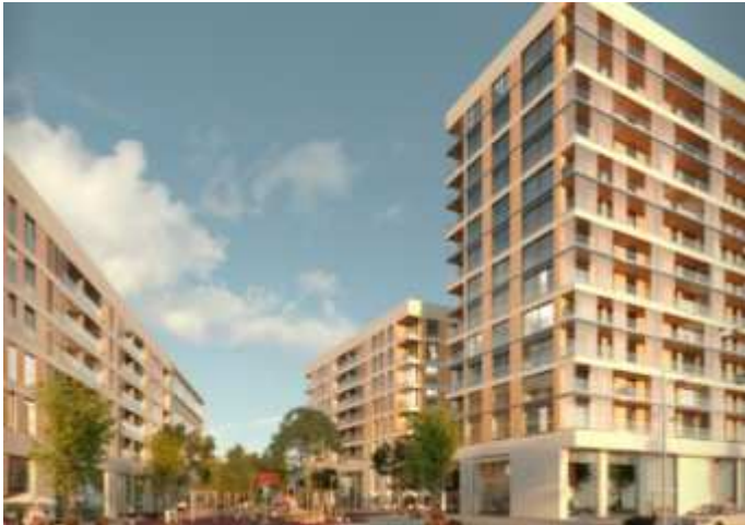
BADALONA O12