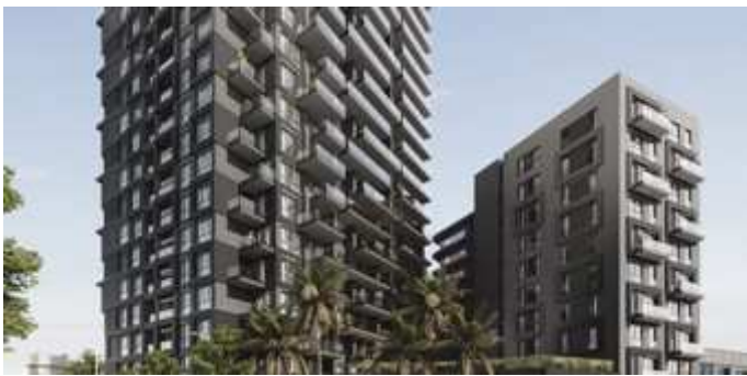
THE KUBE