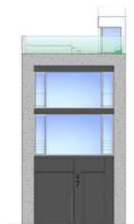
VIVIENDA UNIFAMILIAR ENTRE MEDIANERAS